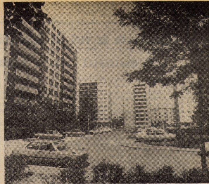
Cu aparatul de fotografiat prin cartierele sibiene de locuințe: ansamblu de blocuri cu 10 etaje din Hipodrom