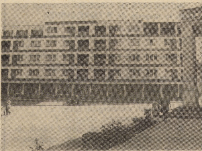
În ultimii ani, prin grija partidului și a statului nostru, în centrul orașului Ocna Sibiului au fost ridicate mai multe blocuri de locuințe, la parterul cărora funcționează diferite unități comerciale și de prestări servicii.

Rubrică întocmită de Sorin CRIVĂȚ, (cu sprijinul serv. circulației al Miliției jud. Sibiu)