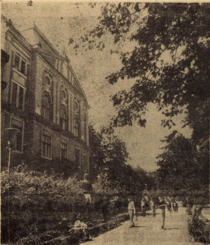
Prin centrul istoric al Sibiului: biblioteca și parcul „Astra”