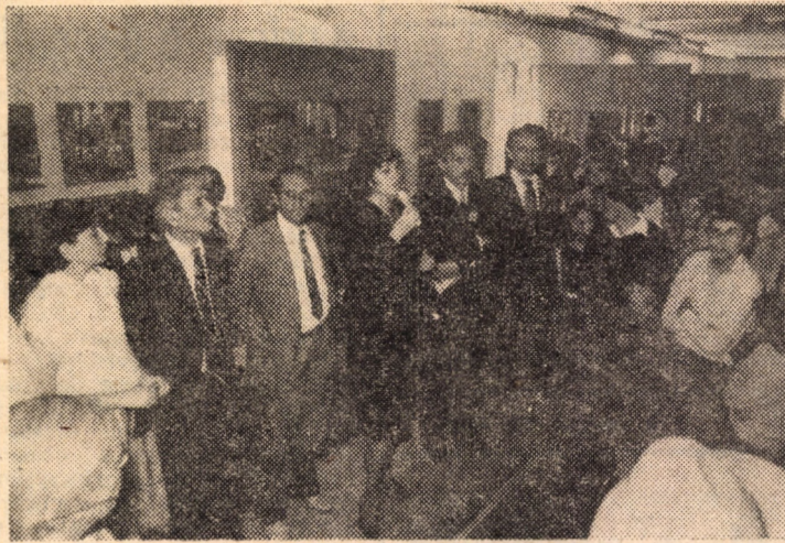
Prin valoroasa sa cuprindere — 1 104 autori din 51 de țări — Salonul internațional de artă fotografică s-a dovedit a fi unul din punctele de maxim interes ale Săptămînii culturale „Cibinium '87.”