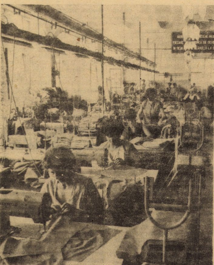
„Steaua roșie” Sibiu: atelierul de executat confecții din bumbac, o nouă capacitate de producție ce a intrat în funcțiune în primul trimestru al acestui an și unde se realizează numai produse destinate exportului.

(Continuare în pag. a III-a) Angela POPESCU