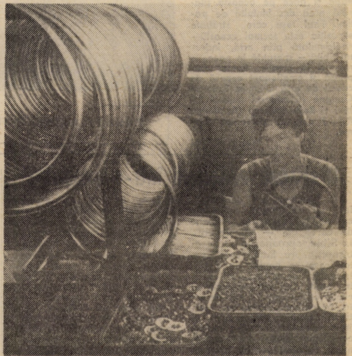
IN PAGINA A II-A:

În continuare, Consiliul de Stat a soluționat unele probleme ale activității curente.