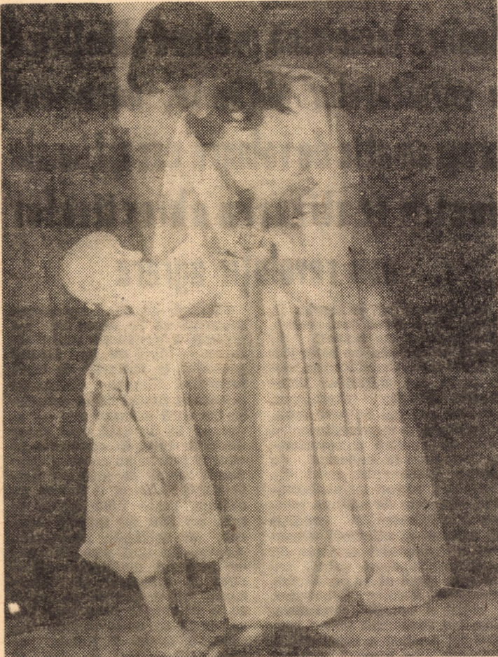
Păpușa Pinocchio, cel mai fascinant personaj al spectacolului, în dialog cu Zina cea bună.