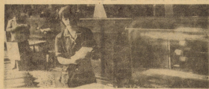
Multe din reperatele produselor realizate la „FLARO” Sibiu sînt obținute în secția termoplaste, cu ajutorul mașinilor de injectat mase plastice

Referindu-se pe larg la sarcinile menționate mai sus, tovarășul Nicolae Ceaușescu a subliniat faptul că pentru traducerea lor în viață este necesară intensificarea responsabilității și continua îmbunătățire a stilului de muncă al organelor și organizațiilor de partid, al consiliilor populare, al organelor agricole centrale și județene, al institutelor de cercetare și învățămînt, al consiliilor de conducere din unități „Fără ordine, fără disciplină, fără o bună organizare, fără un înalt spirit revoluționar nu se poate îndeplini revoluția agrară, nu se pot obține producțiile pe care le avem în vedere în toate județele și în toate unitățile”. Generalizarea experienței înaintate, lichidarea tuturor neajunsurilor apărute reprezintă sarcini imediate pentru toate colectivele de oameni ai muncii acum, cînd „putem să vorbim de perspectivele noii revoluții agrare în România”, pentru a întimplina cu rezultate cât mai bune Conferința Națională a partidului.