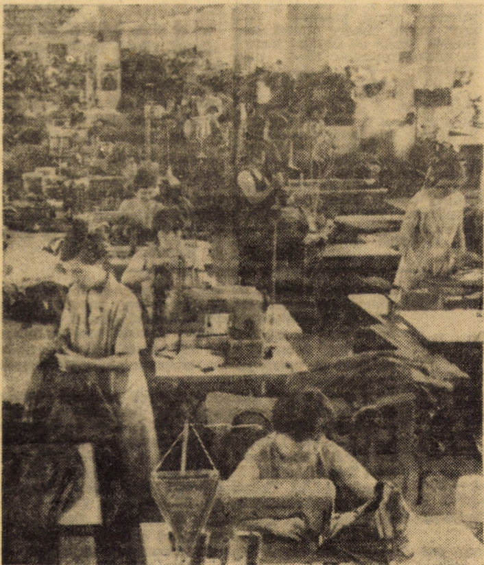
Întreprinderea „Steaua roșie” Sibiu: o secvență surprinzând formațiile de lucru din atelierul confecționat costume bărbătești, în plină activitate.