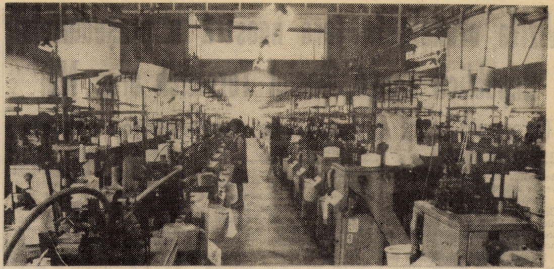
Întreprinderea „7 Noiembrie” Sibiu: secția de tricotat ciorapi fără dungă de la sectorul II, unde predomină buna organizare a producției și a muncii