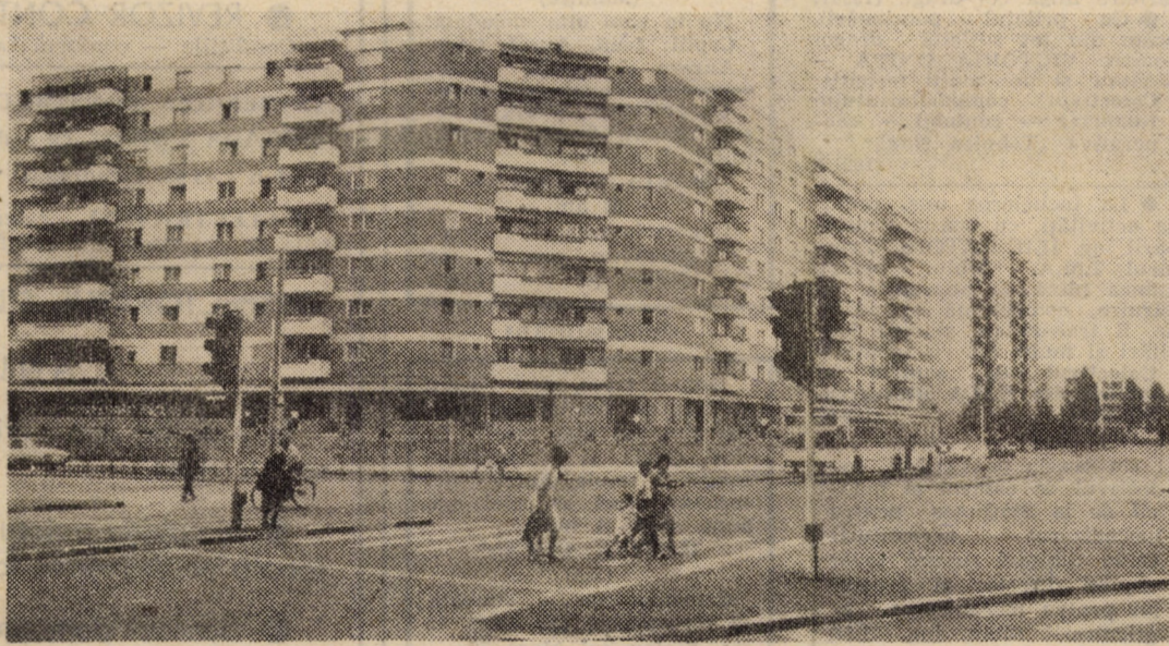
Din peisajul arhitectonic al cartierului Hipodrom III din Sibiu

În vederea diversificării ofertei de export, întreprinderea a pregătit cîteva produse noi, ce vor fi prezentate la T.I.B. '87. Este vorba de un set cuprinzînd modele noi de tacimuri din aluminiu (cuțit, lingură, linguriță și furculiță) și 3 modele noi de garnituri tacimuri din inox, pentru masă. La acestea se adaugă și 33 noi modele de cuțite pentru bucătărie (și acestea cu o multitudine de destinații).