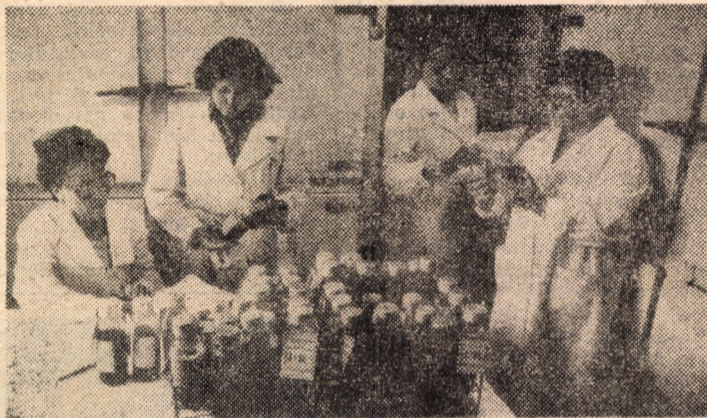
Centrul de recoltare și conservare a singelui Sibiu. Secvență surprinsă în camera de păstrare și expediție, de unde singele și derivatele din singe sînt expediate către secțiile spitalului și la toate unitățile spitalicești ale județului Sibiu

În încheierea cuvîntării, secretarul general al partidului, tovarășul Nicolae Ceaușescu a adresat tuturor oamenilor muncii, elevilor și studenților chemarea de a acționa și a-și uni toate forțele pentru îndeplinirea planului pe acest an și pe actualul cincinal care trebuie să fie cincinalul unei noi revoluții tehnico-științifice.