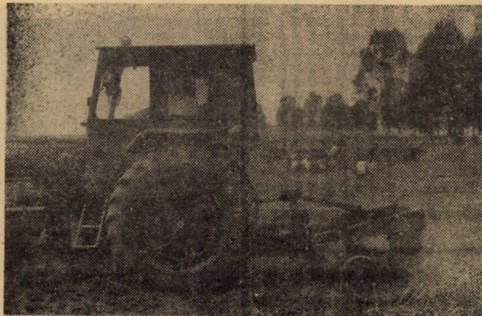
Folosirea la întreaga capacitate a utilajelor din dotare reprezintă o cale sigură pentru încheierea la timp a lucrărilor agricole. În imagine vă prezentăm o mașină de scos cartofi realizată prin autototare la S.M.A. Avrig.

(Continuare în pag. a III-a) I. FLESCHEAN