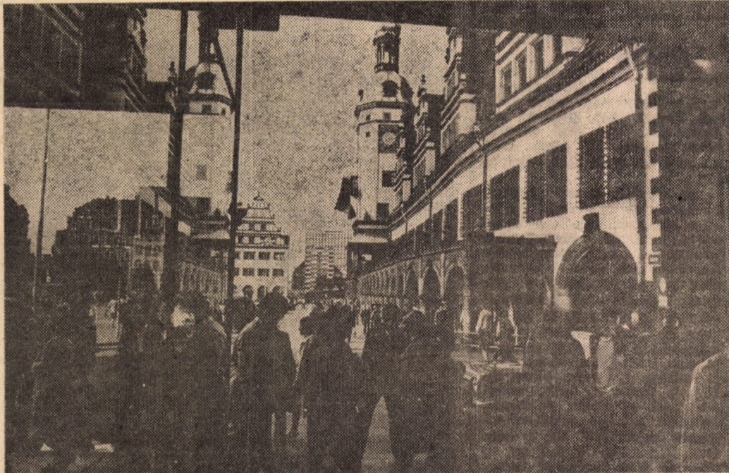
Leipzig: Vedere parțială a „Pasajului Königshaus”, aflat în apropierea „Vechii primării”

redactor la ziarul „Leipziger Volkszeitung”