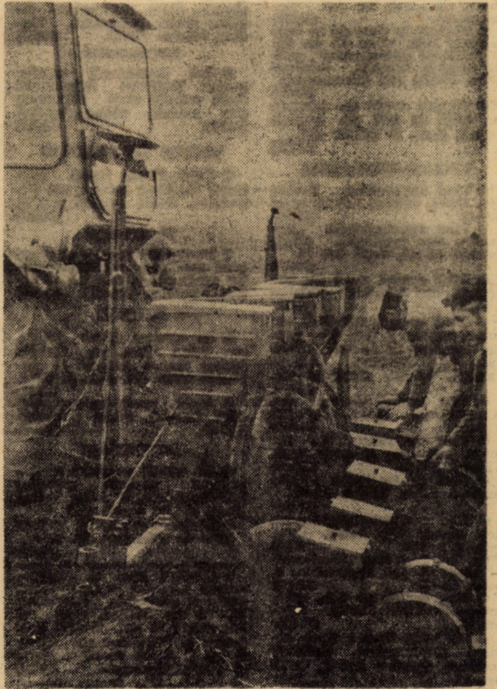
Verificarea mașinilor de încorporat sămința în sol stă permanent în atenția specialiștilor și mecanizatorilor. Orice defect în sistemul de funcționare are repercusiuni ireversibile asupra densității

de porumb obținute de pe suprafețele proprii vom avea în total 6300 t grosiere, ceea ce reprezintă un plus de 40 la sută la acest tip de furaj. La suculente, necesarul este realizat, în prezent, numai în proporție de 81 la sută, dar prin repartizarea a 15000 t tăietei de sfeclă de zahăr cantitatea va fi mult depășită, realizându-se în final — după cum ne asigură directorul întreprinderii, ing. Ianoș Nagy — întregul necesar de furaje, evitându-se repetarea neajunsurilor din iernile trecute. Ținându-se seama de structura modificată a bazei furajere, o importanță deosebită se va acorda îmbunătățirii calității/grosierelor prin diverse modalități, cea mai des folosită metodă fiind prepararea furajului unic, asigurându-se astfel fiecărui animal 5,5 U.N./zi în îngrășătorile de taurine, iar celor 1500 vaci cu lapte hrană suficientă pentru realizarea producției de lapte stabilite.