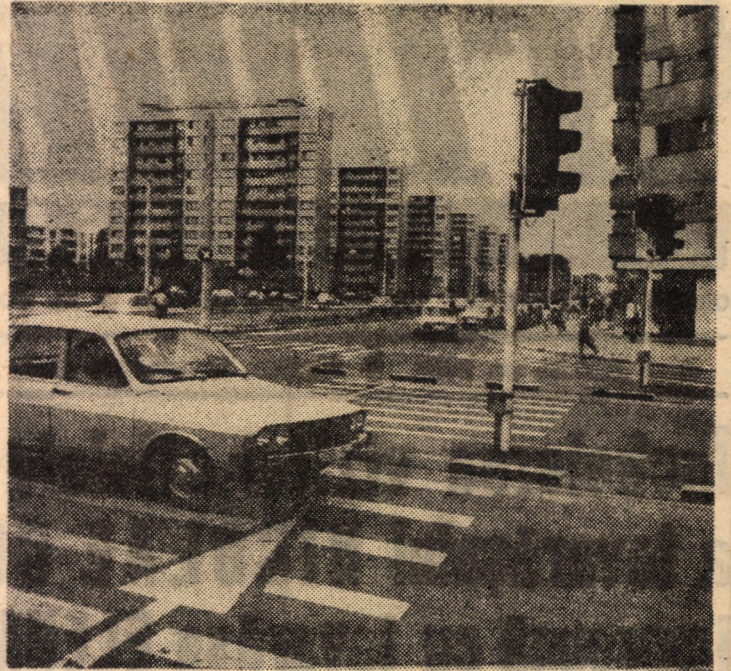
Lucrările de modernizare încheiate de curînd în intersecția străzilor Mihai Viteazul — Kolarov, două artere de circulație intensă din cartierul sibiian Hipodrom, asigură un plus de siguranță pentru pietoni și o fluentă desfășurare a traficului rutier în condiții de deplină securitate în această zonă a urbei