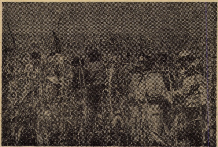
Amplă mobilizare de forțe la recoltatul porumbului. În imagine, un grup de oameni ai muncii de la I.C.S.M.A. Sibiu veniți în ajutorul membrilor cooperatori de la C.A.P. Șura Mare

(Continuare în pag. a III-a) I. FLESCHEAN