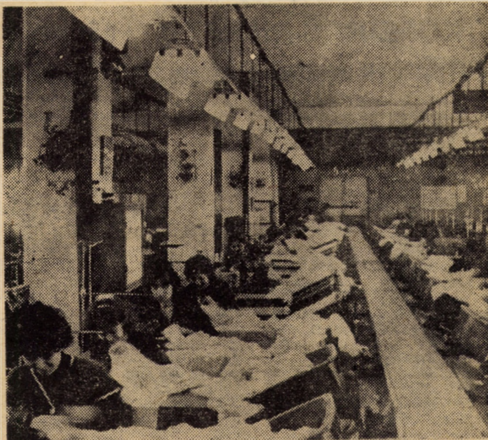
Formație de lucru, cu deservirea locurilor de muncă, din secția confecției lenjerie pentru femei la întreprinderea „Drapelul roșu” Sibiu

Tovarășul Nicolae Ceaușescu, președintele Republicii Socialiste România, împreună cu tovarășa Elena Ceaușescu, va efectua, la invitația președintelui Republicii Turcia, Kenan Evren, o vizită de stat în Turcia, în a doua jumătate a lunii octombrie 1987.