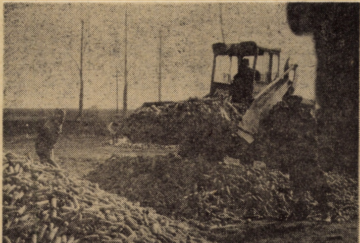
La C.A.P. Ocna Sibiului porumbul ce se recoltează în aceeași zi se expediază în baza de recepție