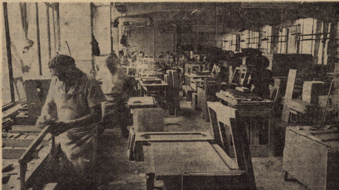
I.P.L. Sibiu, sectorul II mobilă. Vă redăm un aspect de muncă din atelierul pregătire II unde se finalizează manual diferite componente din producția curentă de mobilier, destinată exportului