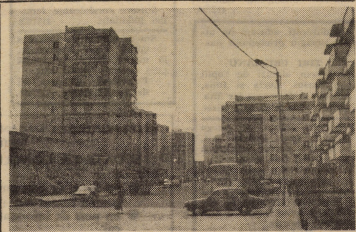
Str. Rahovei, una din arterele de circulație recent modernizate ale cartierului Hipodrom din Sibiu

Despre activitatea comuniștilor, a tuturor cooperativelor de la „Meșteșugarul” Mediaș ar fi multe de spus. Cert este că depășirea planului la prestări servicii cu 11,7 la sută, a celui de export cu 13,4 la sută, a producției fizice cu 10,3 la sută, reducerea cheltuielilor la 1000 lei producție marfă cu 5 lei și a celor materiale cu 12 lei, exprimă pe deplin hotărîrea acestor hărnic și priceput colectiv de a împlini Conferința Națională a partidului cu noi succese, pregătînd, în același timp, cum se cuvine, producția anului viitor.