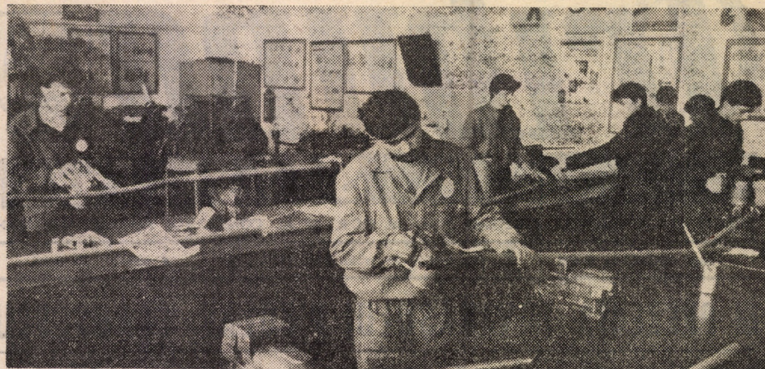
Lucrări practice în atelierele bine utilitate ale Liceului industrial nr. 7 Sibiu, imagine sugestivă pentru amplul proces de legare a învățământului cu producția

În cadrul acestor adunări, cetățenii s-au angajat să contribuie în și mai mare măsură la realizarea planului în profil teritorial, la mai buna gospodărire și înfrumusețare a orașului, să participe la toate acțiunile inițiate de consiliul popular orașenesc. (A. P.)