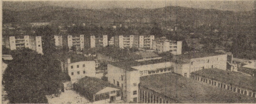
Vedere din municipiul Mediaș, localitate reprezentativă a județului Sibiu, aflată sub semnul permanent al înnoirilor socialiste

Adunarea cetățenească din municipiul Mediaș s-a încheiat printr-un reușit program artistic susținut de artiști amatori laureați în cea de a VI-a ediție a Festivalului național „Cîntarea României”.