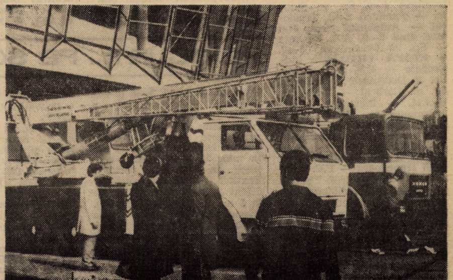
Noile tipuri de autospeciale realizate la „Automecanica” Mediaș stîrnesc curiozitatea vizitatorilor