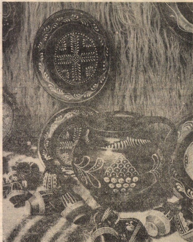
Insuflețit de meșterul olar, lutul cîntă prin formă și culoare