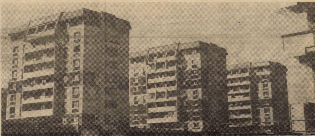
Din peisajul arhitectonic al noului cartier sibian de locuințe „Valea Aurie”.