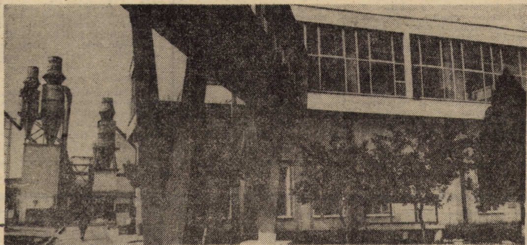
Sectorul II mobilă al I.P.L. Sibiu — unitate cu tradiție pe harta industrială a municipiului nostru

președinte al Comisiei județene a inginerilor și tehnicienilor