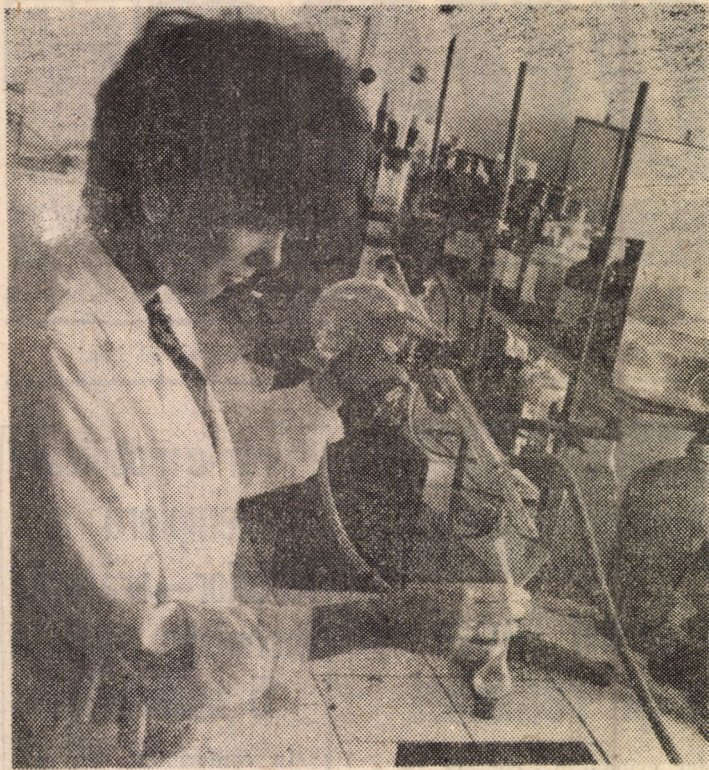
În laboratorul de analize fizico-chimice al Oficiului de gospodărire a apelor Sibiu, se veghează în permanență asupra calității alimentare.

Astăzi, 5 noiembrie, ora 15, în cadrul manifestărilor politico-educative și cultural-artistice desfășurate sub genericul „Toamna cisnădiană“, la Casa de cultură a sindicatelor