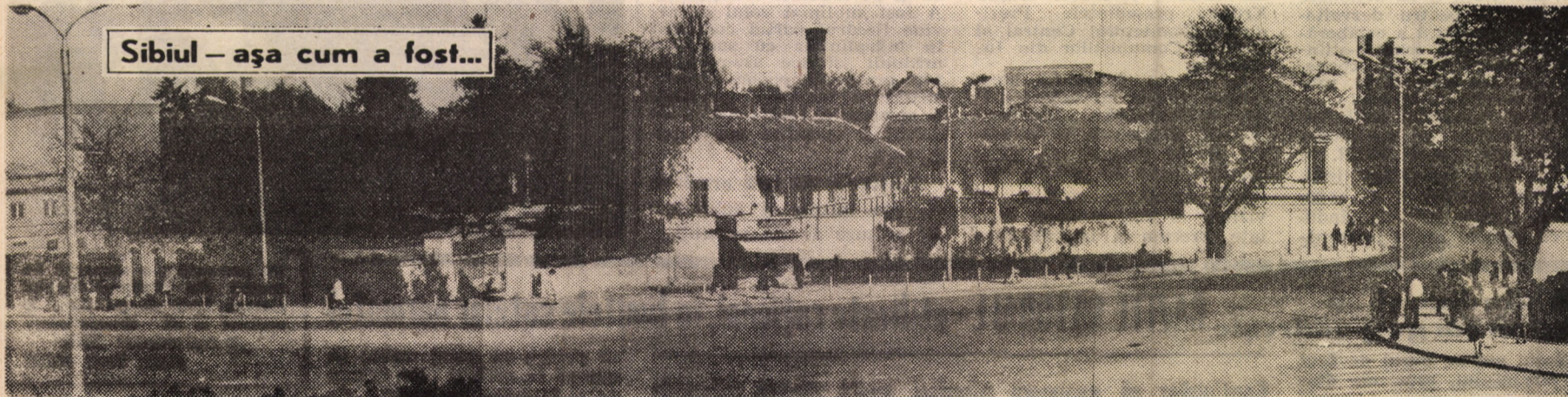
Sibiul — așa cum a fost...