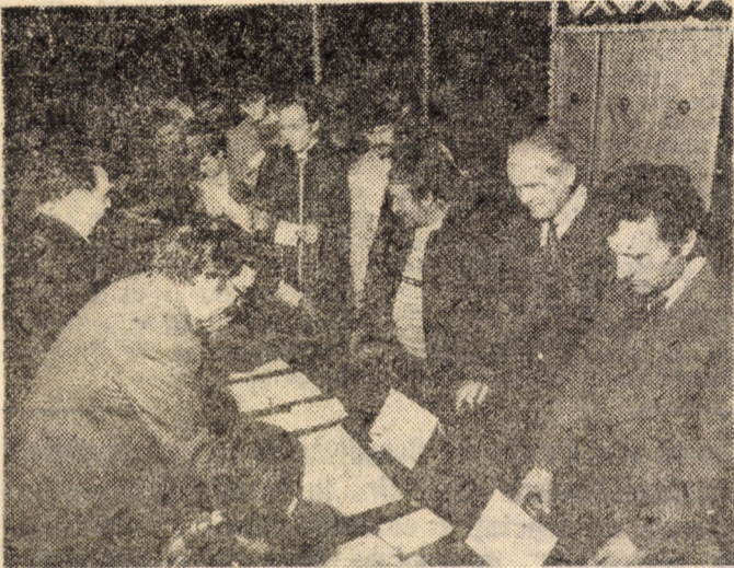
Din schimbul de noapte la vot. Un grup de muncitori de la întreprinderea „Independența” din Sibiu votează la secția 41

Prezenți în mijlocul alegătorilor, redactorii ziarului încredințează tiparului cele mai relevante aspecte ale acestei zile încărcate de adânci semnificații politice și sociale.