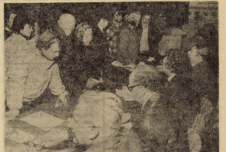
La secția de votare din Axente Sever marea majoritate a cetățenilor a votat în primele ore ale dimineții

Interesați în tot mai buna gospodărire și înfrumusețare a localității în care trăiesc și muncesc, cetățenii din Porumbacu de Jos au făcut numeroase propuneri la întîlnirile cu candidații de deputați, exprimîndu-și, totodată hotărîrea de a sprijini toate acțiunile inițiate pentru obște, cu obște, conștienți că trebuie să-și aducă o și mai mare contribuție la realizarea programului de autoaprovizionare, a planului la fondul de stat. Să amintim, că, pe zece luni, locuitorii acestei comune fruntașe între localitățile județului au realizat, prin muncă patriotică, lucrări în valoare de peste 2,6 milioane lei, că planul de carne la fondul de stat a fost realizat în perioada la care ne referim, că în cadrul acțiunii de autofinanțare, Porumbacu de Jos a realizat un excedent bugetar în valoare