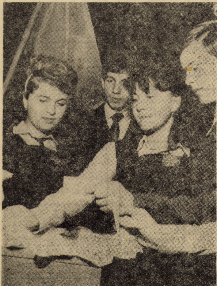
Primul vot — moment de referință în viața fiecărui tînar. Emotiile și bucuriile trăite cu acest prilej — al participării directe la actele fundamentale de conducere a societății — se pot citi și pe fețele acestor tineri care și-au exprimat opțiunile electorale la Dumbrăveni

cameră, cînd sînt montate într-o lustră, rezultă că aria de manifestare a spiritului gospodăresc este suficient de largă. Deci, pe lângă eliminarea becurilor inutile, mai poate fi luată în discuție înlocuirea acestora cu becuri de putere mai mică, respectiv concentrarea activităților casnice într-o singură cameră (unde este posibil așa ceva, bineînțeles), utilizînd un singur bec. Procedînd astfel, înlocuind prin munci casnice aparatele electrocasnice, orice familie se poate încadra în cota normată. Și, aproape de aparatele electrocasnice, ținem să reamintim că utilizarea acestora este interzisă în perioada consumului de vîrf. Din păcate, această interdicție este deseori ignorată. Mai mult, tocmai acum și tocmai în perioada vîrfului de sarcină de geară s-au găsit unii cetățeni să-și închidă balcoanele utilizînd aparate de sudură de construcție artizanală! Organele de control ale I.R.E. Sibiu își vor face cu fermitate datoria, dar pînă atunci trebuie să intre în acțiune opinia publică, colectivitatea. Facem și pe această cale apel la cetățeni să nu treacă nepăsători și să nu tolereze nici un fel de fenomen de risipă care, prin multiplicare, poate afecta buna desfășurare a vieții economico-sociale a unor întregi colectivități.