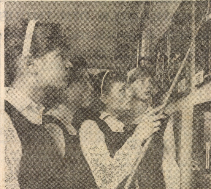
Aspect din timpul unei ore în care se face studierea simulatoarelor privind organele de lucru de la mașinile de tricotat, în cabinetul de tehnologia tricoturilor, la Liceul textil „7 Noiembrie” Sibiu

te plastice destinate nevăzătorilor (faptul se referă la artiștii plastici) ● cu toate că prioritatea ar fi atribuită (în ordine descrescătoare) sculpturii, modelajului, alto-reliefului, basoreliefului, metaloplastiei, gravurilor diferite, feluritelor combinații textile, grafica și pictura ar reuși să completeze bagajul informațional și cultural, îmbogățind sau nuanțînd patrimoniul reprezentărilor individuale ale nevăzătorilor ● învățămîntul special ar beneficia de o seamă de viitoare studii efectuate în această direcție, putînd contribui mai mult la adîncirea personalității nevăzătorului ● acțiunea, în sine, s-a bucurat de aprecierea nevăzătorilor, care propun organizarea altora similare, dorînd să cunoască mai îndeaproape lucrări de artă contemporană, dorînd să se implice mai mult în prezențele culturale sibiene. (S.D.)