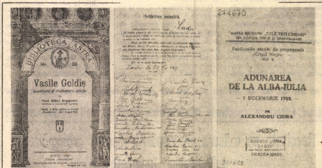
Imagini de la expoziția documentară dedicată Unirii, deschisă zilele trecute la Biblioteca Astra — Sibiu

Azi, 3 decembrie, la Biblioteca Astra (Cabinetul „Andrei Oțetea”) ora 9, va avea loc simpozionul Relații istorice și culturale tradiționale între Vilcea și Sibiu.