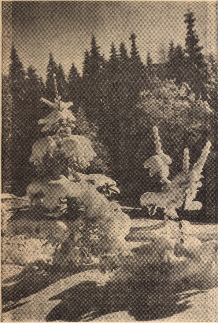
Decor montan de decembrie