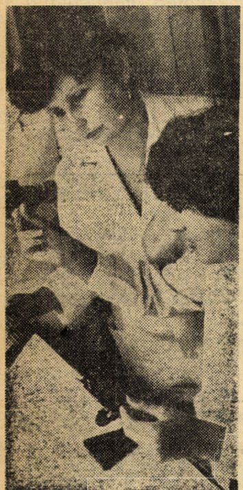
Laboratorul imuno-serologic al Centrului de recoltare și conservare a singelui Sibiu — o muncă plină de răspundere și probitate profesională