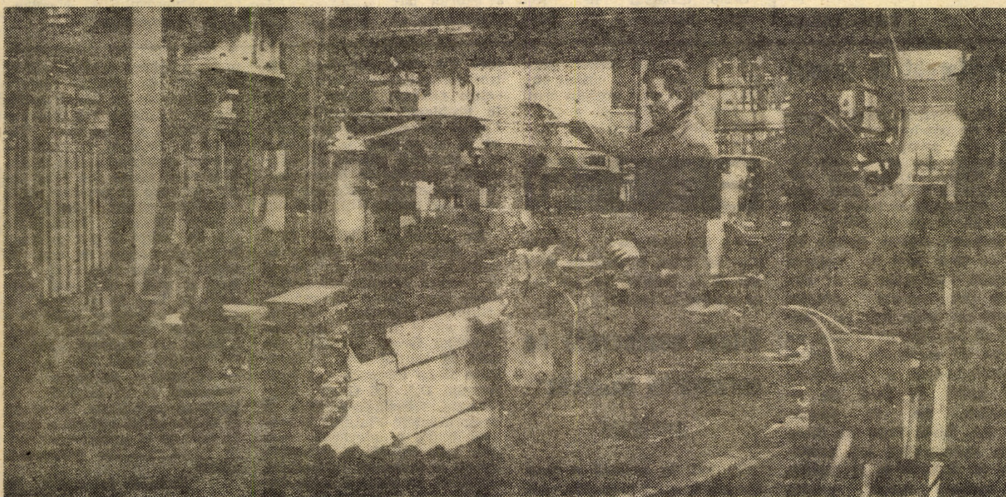
Întreprinderea „Balanța II” Sibiu: ultimele reglaje înaintea începerii probelor de anduranță la linia de prelucrare prin transfer a corpurilor de distribuție