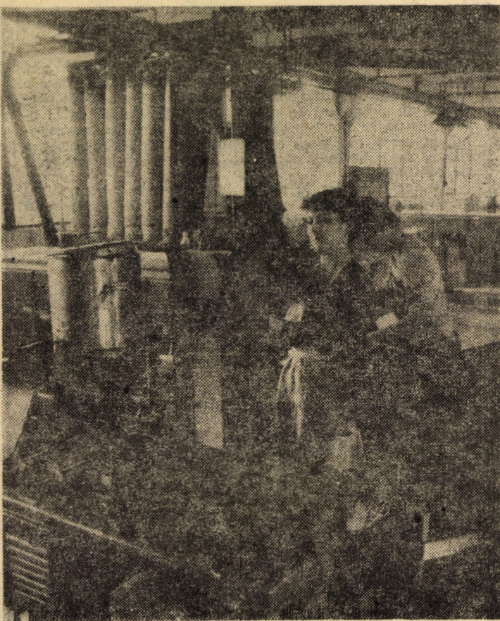
I.P.L. Sibiu, unitatea creioane. Vă redăm un aspect de muncă din interiorul noii capacități, parțial intrată în funcțiune unde, cu ajutorul unei moderne linii tehnologice se realizează încheierea și uscarea blocurilor, rezultînd într-un schimb peste 86 000 creioane

Faptașul s-a ales cu o pedeapsă și cu obligația de a repara prejudiciul adus avutului obștesc. La fel, s-a reținut și vinovăția conducătorului auto A.M., încadrat la I.J.T.L. Sibiu, care abuzînd de această calitate, a efectuat în schimbul unor sume de bani, un număr de 13 transporturi clandestine, aducînd o pagubă unității pe care a trebuit să o repare. Acestor făptuitori li s-au aplicat pedepse pe măsura gradului de pericol social al faptelor comise. Cîteva exemple — desigur nedorite — care demonstrează însă grija deosebită pe care statul socialist o acordă apărării unor valori fundamentale ale societății noastre — proprietatea socialistă.