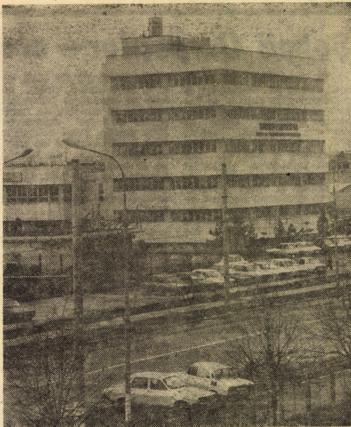
Imagine-detaliu din ansamblul construcțiilor ridicate în anii din urmă în zona industrială Sibiu-est a municipiului. Fotografia vă redă o vedere parțială a Fabricii de utilaj metalurgic și turnătorii aparținînd cunoscutei întreprinderi „Independența”