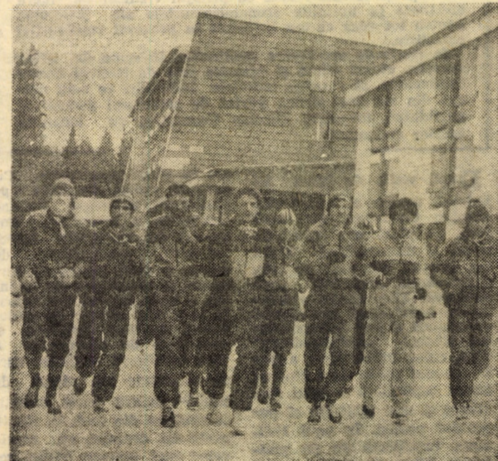
Interiştiile începînd un nou antrenament

20,00 20,20 I ducăto: 20,40 I făptuir ții agr frunțaș cută, i nic g 20,55 dia. D 21,10 în ser șianu jurnal. rea pr SIBI „Pistru 11; 13; Arta două 11,30; 17 și pentru Tine Song rele 9 iar la sărbăt MEI sul: „ acesta 13; 15 Cent nent 9; 11; CIS berto mantu 11; 17 DUI „Anor orele OC „Ape 17 și Tea biu I le 17 colete un p (Ab. și Li Joz motei zofia dem 16. Ioa Lazăr văt luție ditur pagir Ma „Afo maxi „Fac lei 5 Ge „Din soave la i niei. Elisa Gerr Cuvî tin „Bib rion rion. 23. Me serv apre va acea anul vari ales ning pînă vest min prin grac me de. la I cm, de