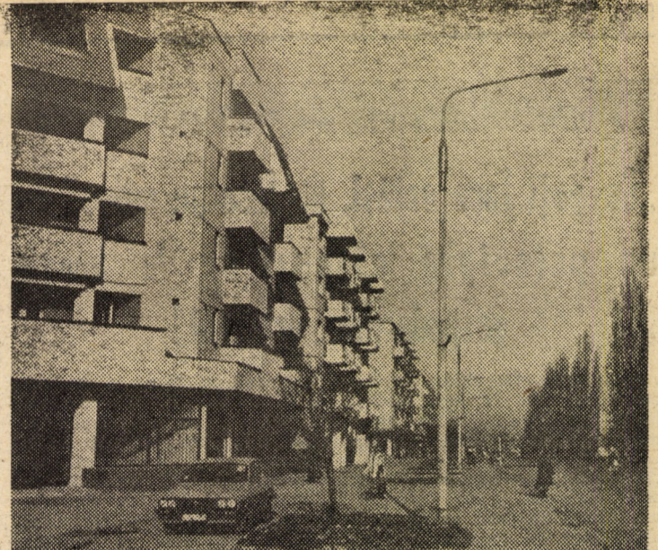
Recent, peisajul edilitar din Sibiu s-a îmbogățit cu noi și moderne construcții de locuințe, cum sînt cele de pe str. 11 Iunie

• Autoconducere — autoaprovizionare — „Ce poți face astăzi nu lăsa pe mîine” — un principiu călăuzitor în munca gospodariilor orlăteni! SPORT; Informații (În pagina a II-a)