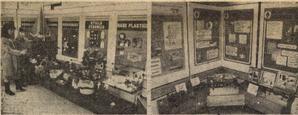
Secvențe din Expoziția de creație tehnico-științifică