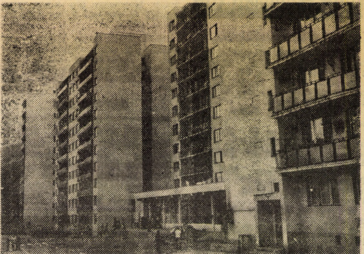
Blocuri cu 10 etaje în cartierul „Gura Cimpului” — Mediaș