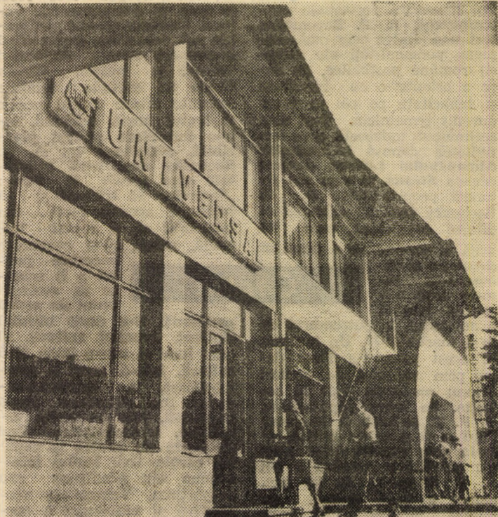
În centrul comunei Avrig funcționează un mare magazin „Universal”