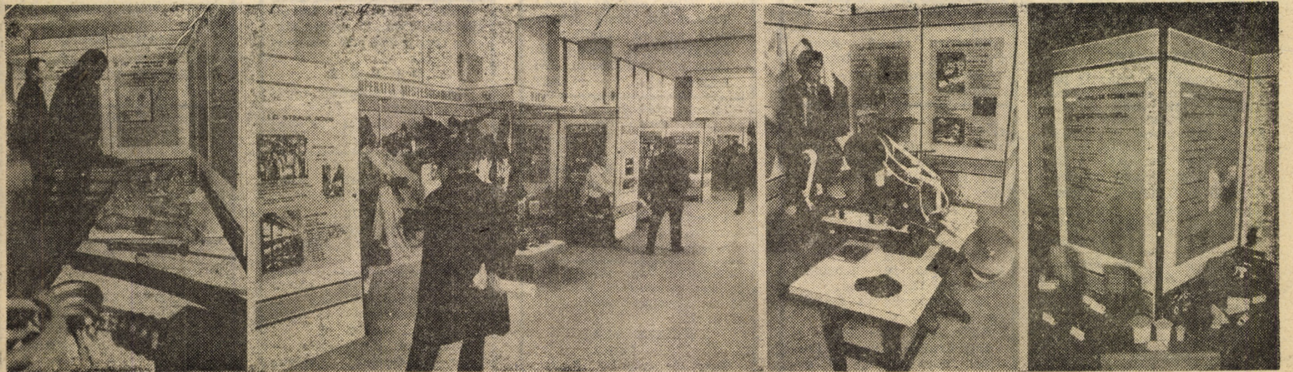
Aspecte din expoziția de creație tehnico-științifică, deschisă la Casa de Cultură a Sindicatelor din Sibiu

Într-o atmosferă de puternic entuziasm, participanții la plenară au adresat o telegramă tovarășului NICOLAE CEAUȘESCU, secretar general al Partidului Comunist Român, președintele Republicii Socialiste România.