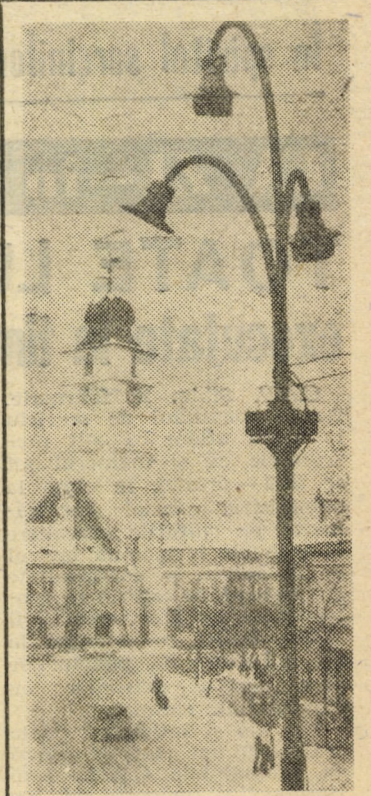
Peisaj de iarnă din centrul Sibului