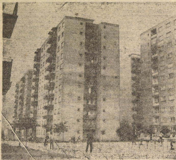
MEDIAȘ - Cartierul „După zid”