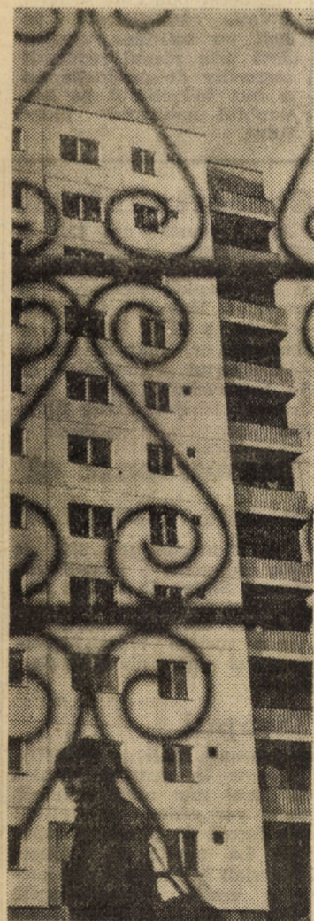
ASCENSIUNILE COTIDIANULUI. Imagine din cartierul „Vasile Aaron” Sibiu