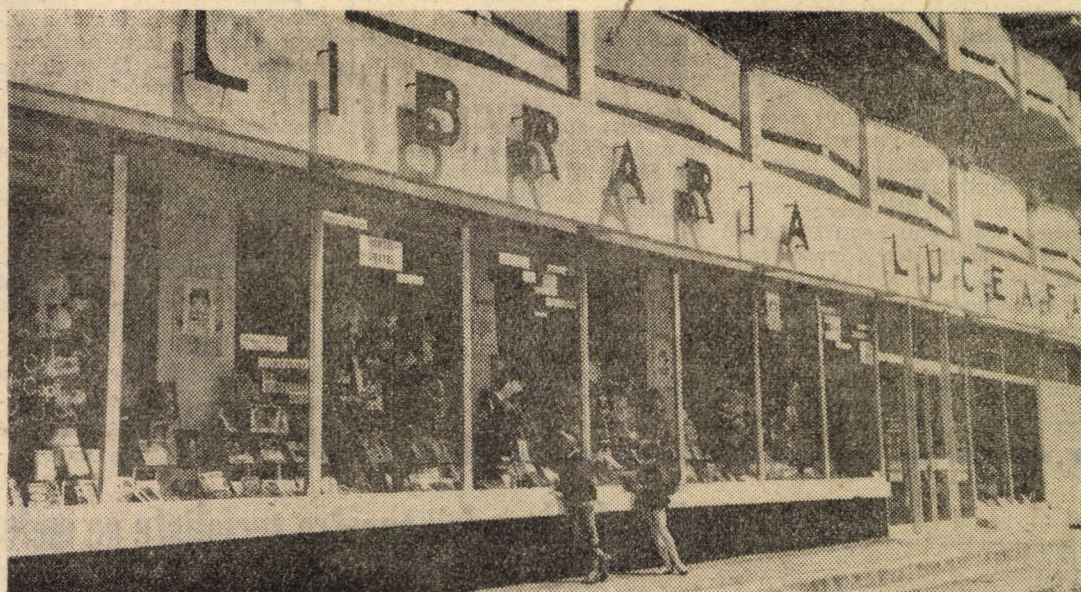
In imagine Librăria „Luciafăru” din Sibiu