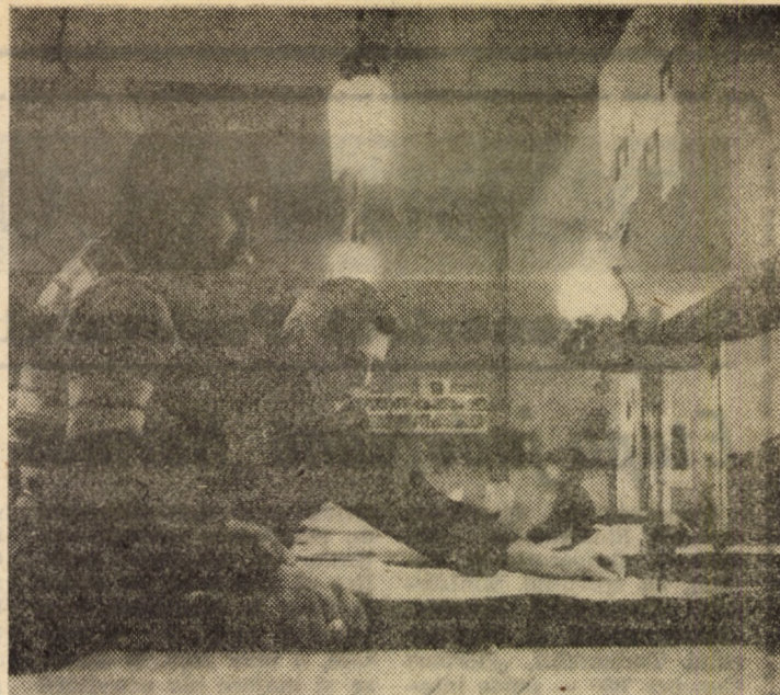
Imagine de la decuparea materialelor, după șabloane, cu ajutorul mașinilor de croit - una din primele operații pregătitoare ale procesului tehnologic pentru liniile de confecționare la întreprinderea de confecții „Steaua Roșie” Sibiu