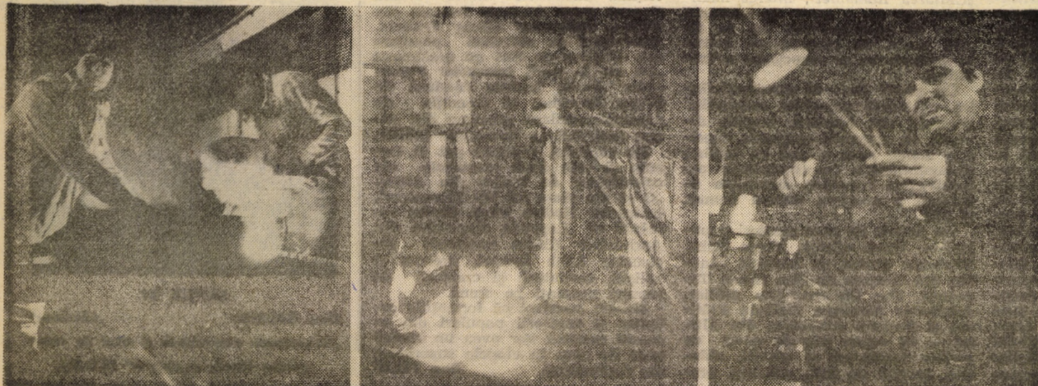
Aspecte de muncă din atelierele de sudură și prelucrări mecanice din cadrul Sectorului de service pentru zootehnie