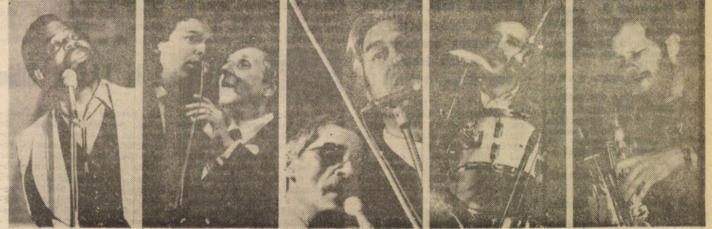
Imagini din ultimele două serii ale Zilelor jazzului Sibiu '88

20,00 20,25 conomi Progra nizare. progres teral decenii nizarea minist dețu 21,00 F frumus muzica gramul a terit sistema tăților dere e re (c). și cr științifi jurnal. rea pr ci SIBI „Vagal serii.” 16; 19 Arta orele la ore tacole Time ranții” orele 18,30. Filmul vezi” Inde te n sapte 10; 16 MEL gresul Neme: 11; 13 Cen mul r 19; 11 I „Moar orele CIS mul cietat 17 și AG mir 19. DU „Epic orele CO „Miti rele AP „Tart și 19. OC „Ince Yung 19,30. MO muz In lor d că or plexu joi, 3 5 ap Casa xand zintă de a manc m Me servi pesc vrem ră și șor riabi mod Tem me între cele și 1 fa, l pada tiniș Bile