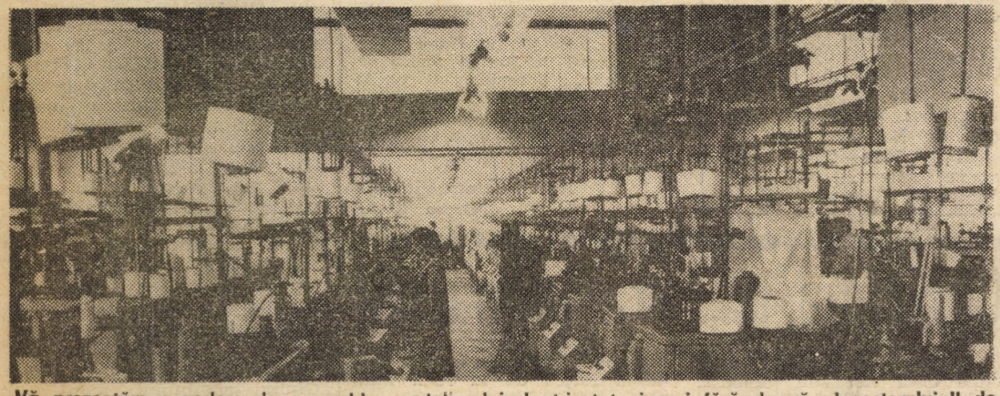
Vă prezentăm o vedere de ansamblu a atelierului de tricatat ciorapi fără dungă al sectorului II de la întreprinderea „7 Noiembrie”, Sibiu — atelier dotat cu utilaje moderne, de înaltă complexitate și randament