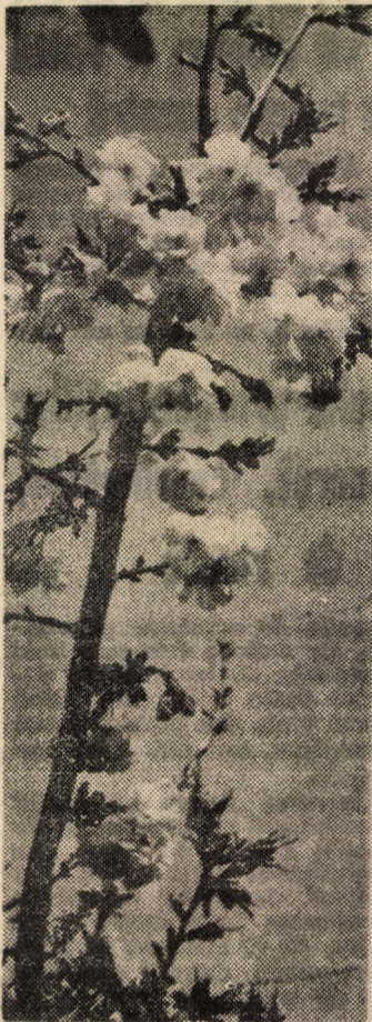
Decor de primăvară