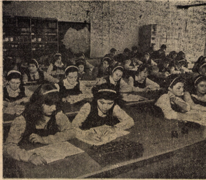
În timpul unei ore de laborator cu elevii clasei a XI-a B — profil chimie-biologie — de la Liceul „Octavian Goga” din Sibiu

Marinciu Sufrim s.a. „Instalații de legare la pămînt”. Colecția „Electricianului”. Editura Tehnică, 360 pagini. Lei 18,