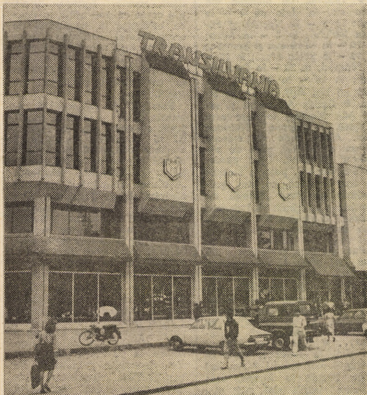
Printre noile construcții social-edilitare realizate în anii „Epocă Nicolae Ceaușescu”, se numără și modernul și frumosul magazin universal „Transilvania” din Mediaș

La invitația tovarășului Nicolae Ceaușescu, secretar general al Partidului Comunist Român, președintele Republicii Socialiste România, tovarășul Andrei Andreievici Gromîko, membru al Biroului Politic al Comitetului Central al Partidului Comunist al Uniunii Sovietice, președintele Prezidiului Sovietului Suprem al Uniunii Republicilor Sovietice Socialiste, va efectua o vizită oficială de prietenie în țara noastră, în a doua decadă a lunii mai a.c.