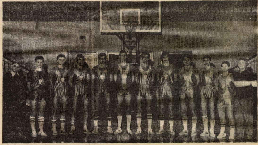
Echipa de baschet C.S.U. Balanța