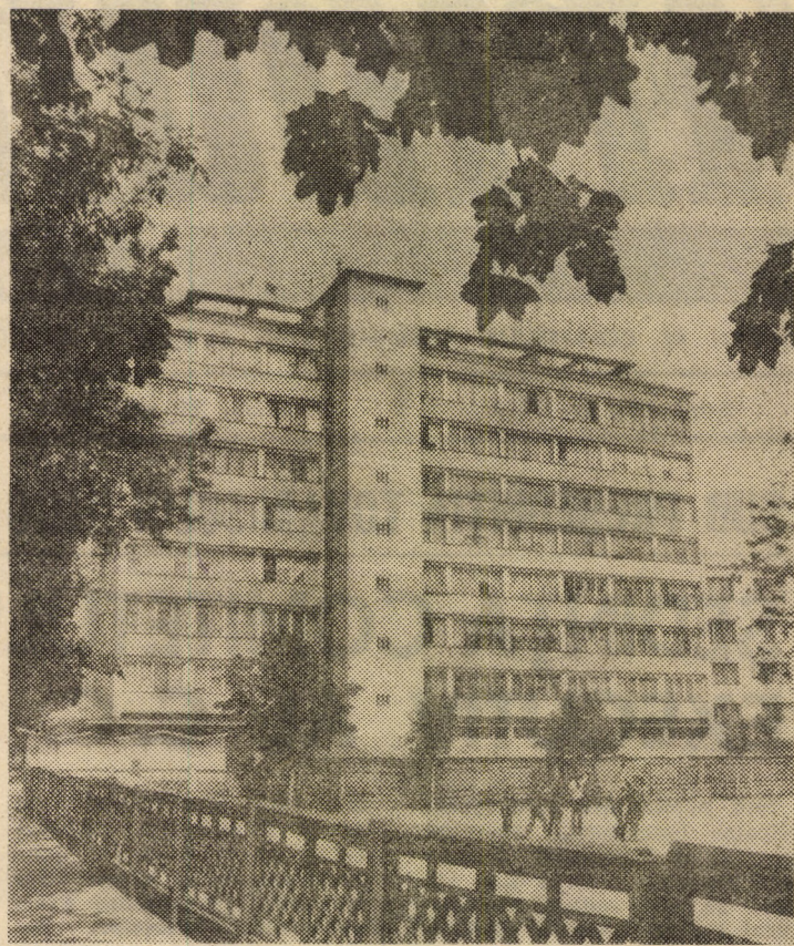
Din peisajul cartierului Terezia, Sibiu

ului, orele 10; 17 și 19,30 — gală cu filmele „De ce fumăm”, „Citeva minute pentru masă”, „Lumina ochilor”. Clubul „7 Noiembrie” Sibiu, orele 10; 15; 18 — gală cu filmele „Al treilea ochi”, „Singele — puterea vieții”, „Inimi fragile”.