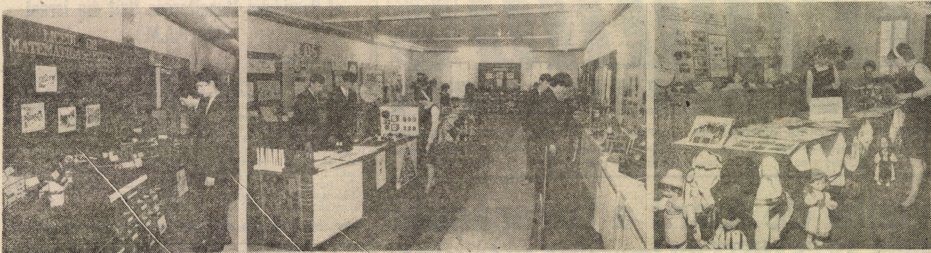
Imagini din Expoziția cu material didactic și mijloace de învățămînt deschisă la începutul acestei săptămîni la Casa Artelor din Sibiu