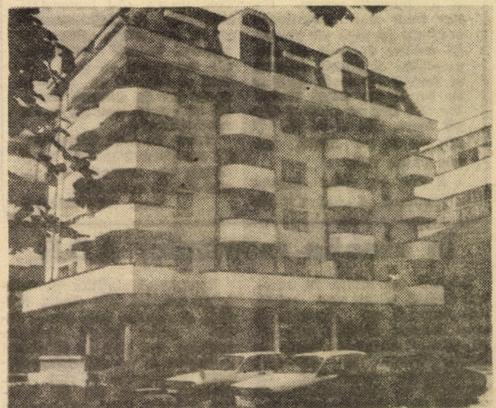
Confort, eleganță, bun gust — o triadă îngemănată în noile blocuri construite pe B-dul Victoriei Sibiu