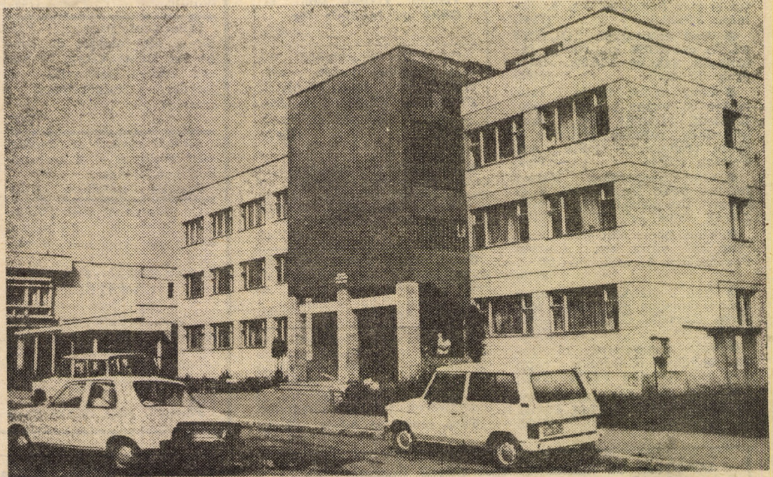
Dispensarul medical din str. Kolarov — una din unitățile sanitare care asigură asistență medicală unui mare număr de cetățeni din cartierul sibian Hipodrom, obiectiv social ridicat în anii „Epocii Nicolae Ceaușescu”

Prezentarea concurenților pentru selecție și repetiții — luni, 30 mai, ora 10, la sala Studio a Casei de Cultură a Sindicatelor, iar concursul va avea loc marți, 31 mai, ora 14 la Clubul „7 Noiembrie” din Sibiu.