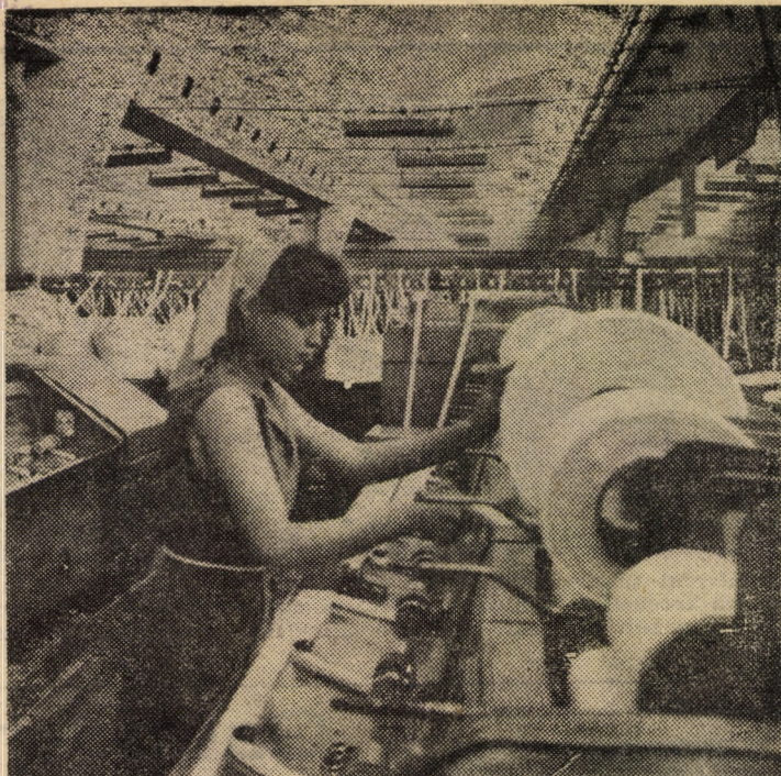
Printre întreprinderile de pe raza județului nostru care, pentru bunele rezultate obținute în întrecerea socialistă pe anul 1987 au obținut „Ordinul Muncii Clasa III-a”, se numără și „Furul Roșu” Tâlmăciu