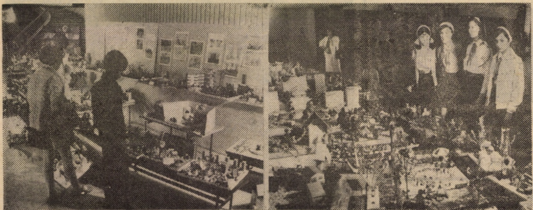
La nivelul tuturor unităților preșcolare și școlare — în luna iunie — se finalizează activitatea cercurilor tehnico-aplicative și cultural-artistice prin organizarea de expoziții. C.J.O.P. Sibiu a reunit cele mai reușite creații într-o expoziție, de unde vă prezentăm cele două imagini.