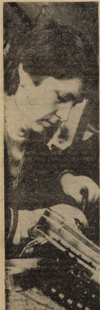
Un aspect de la montajul cintarelor de uz casnic la întreprinderea „Balanța” Sibiu