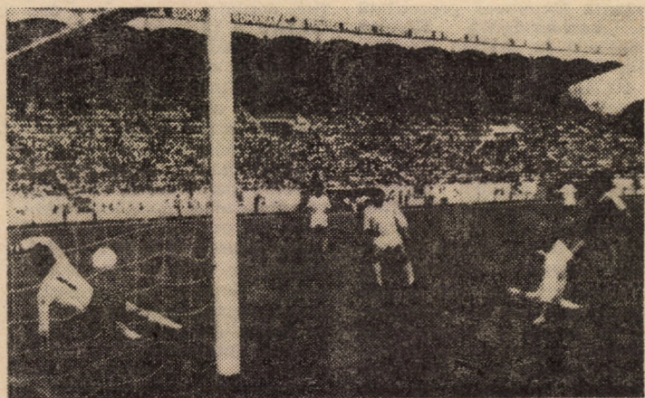
Stănescu (primul din dreapta) interiştilor