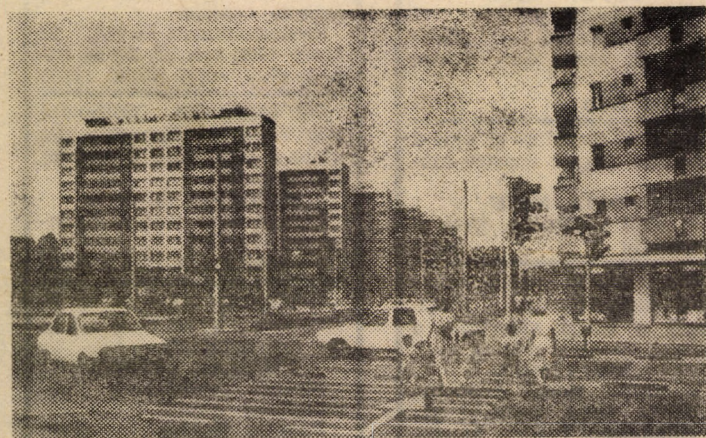
Blocuri în cartierul Hipodrom III Sibiu

Pe scurt, redăm cîteva aspecte mai importante privind tehnologia de creștere și patologia acestei specii. Incubarea ouălor este calculată în așa fel, încît ecloziunea să corespundă cu apariția frunzelor de dud. Perioada de incubare este de 15—18 zile. Temperatura are un rol deosebit de important în ecloziune și în dezvoltarea larvelor. Temperatura optimă este de 24°C în momentul apariției primelor larve. În condițiile unei hibernări normale, procesul eclozionării este de 2—3 zile. În perioada larvară, care durează circa 30 zile, larva se hrănește abundent și crește, în general, de 7 000—10 000 ori. În cursul perio-