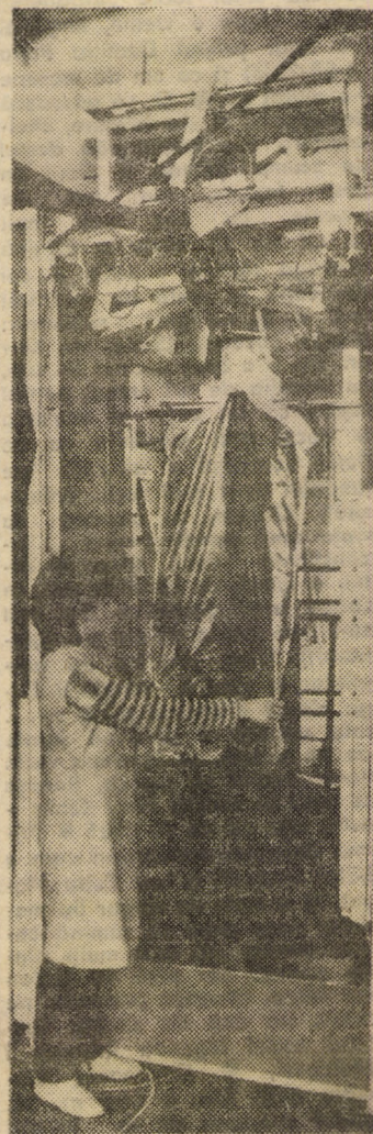
Întreprinderea „Steaua Roșie” Sibiu. În imagine: robotul de ambalat confecții în folie de polietilenă, utilaj complex de înaltă productivitate, de curînd dat în funcțiune