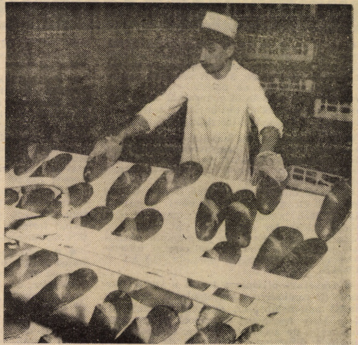
Întreprinderea de Morărit, Panificație și Paste Făinoase Sibiu. Noua fabrică de piine, recent intrată în funcțiune în cartierul Hipodrom

Pretutindeni, secretarul general al partidului i-au fost adresate cele mai calde mulțumiri pentru vizită, pentru indicațiile și îndemnul formulat pe acest prilej, fiind exprimat angajamentul ferm de a face totul pentru a le transpune exemplar în practică, pentru înregistrarea unor rezultate cât mai bune. Cei prezenți au dat glas, prin puternice aplauze și ovații, satisfacției deosebite pentru această vizită de lucru, profund recunoscînd pentru grija pe care tovarășul Nicolae Ceaușescu o manifestă permanent față de continua dezvoltare și modernizare a țării, față de sporirea nivelului de trai al întregului nostru popor.