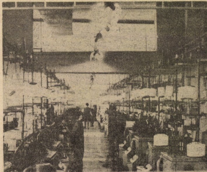
Vă redăm o imagine de ansamblu din secția mașini circulare de tricostat a întreprinderii „7 Noiembrie” Sibiu, sectorul II